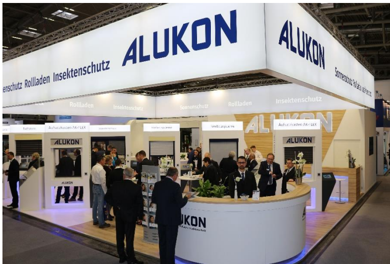
Bild 2: Das neue Alukon Firmenlogo wurde erstmalig auf der Messe BAU in München, der Weltleitmesse für Architektur, Materialien und Systeme, offiziell vorgestellt.